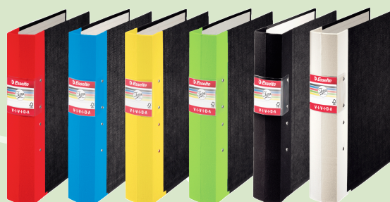
Esselte Jopa Vivida

Det är en fördel för dig som konsument att äntligen få möjligheten att välja en miljömärkt träryggspärm. Bra kvalitet gör hållbarheten längre vilket bidrar både till god miljö och sparsamhet.