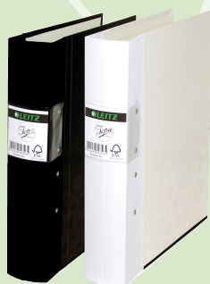
Leitz Jopa Bebop